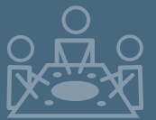
HUGMYND #8 SPILA SAMAN