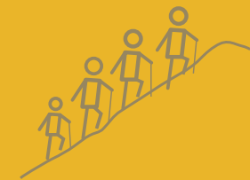
HUGMYND #4 FARA Í FJALLGÖNGU SAMAN