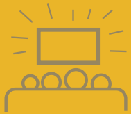
HUGMYND #7 HORFA Á BÍÓMYND SAMAN