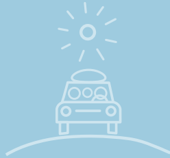
HUGMYND #16 FERÐAST UM LANDIÐ SAMAN