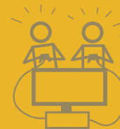
HUGMYND #18 SPILA TÖLVULEIK SAMAN